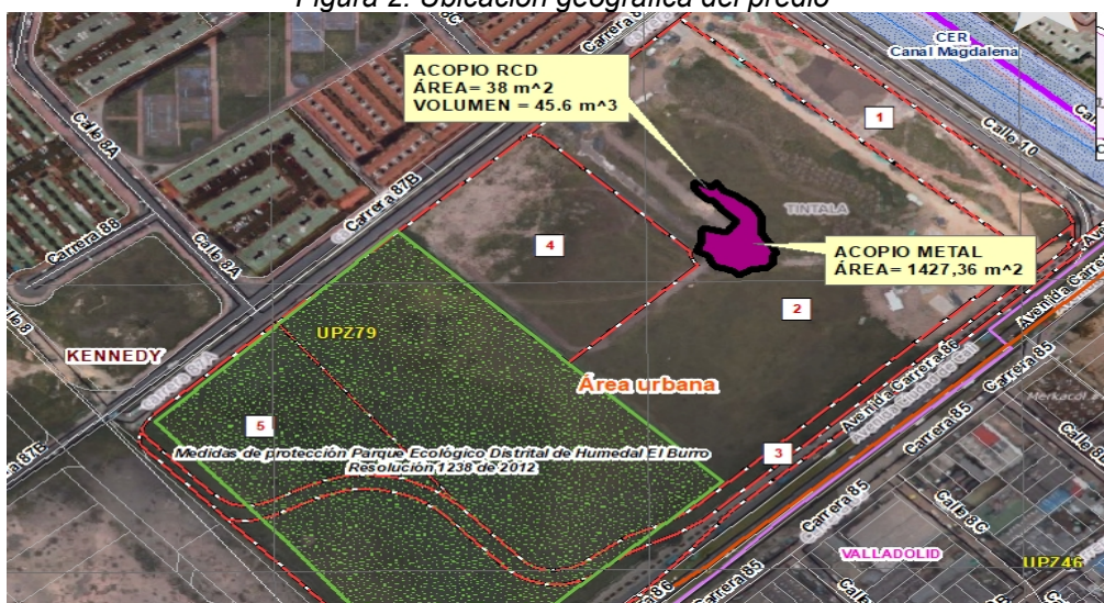
Figura 2. Ubicación geográfica del predio

El predio objeto de la visita técnica corresponde al denominado “OTERO DE FRANCISCO (ETAPA V)” ubicado en las direcciones Avenida Carrera 86 No. 8F - 35, Carrera 87B No. 8A - 2, Carrera 87 B 8 2, Carrera 87 B 8 A 72, Carrera 87 B 8 30, Avenida Carrera 86 No. 8 - 35 “OTERO DE FRANCISCO (ETAPA V)”, en la UPZ El Calandaima de la Localidad de Kennedy (Figura 2).